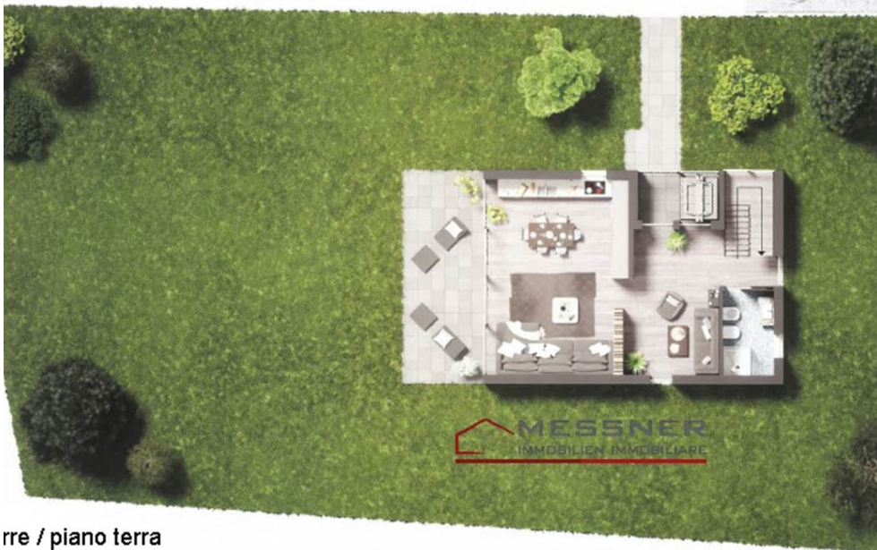
re / piano terra